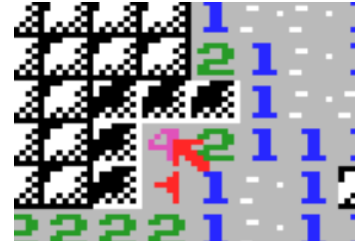
Figura 3: duplo clique na célula marcada com um "4" com apenas uma bandeira adjacente.