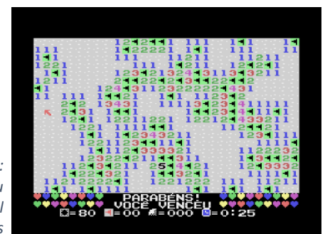
Figura 3 (dir.): Fim de jogo: Você venceu (todas as bandeiras no local certo e telhas removidas)

Note a bandeira em magenta, colocada em local incorreto.